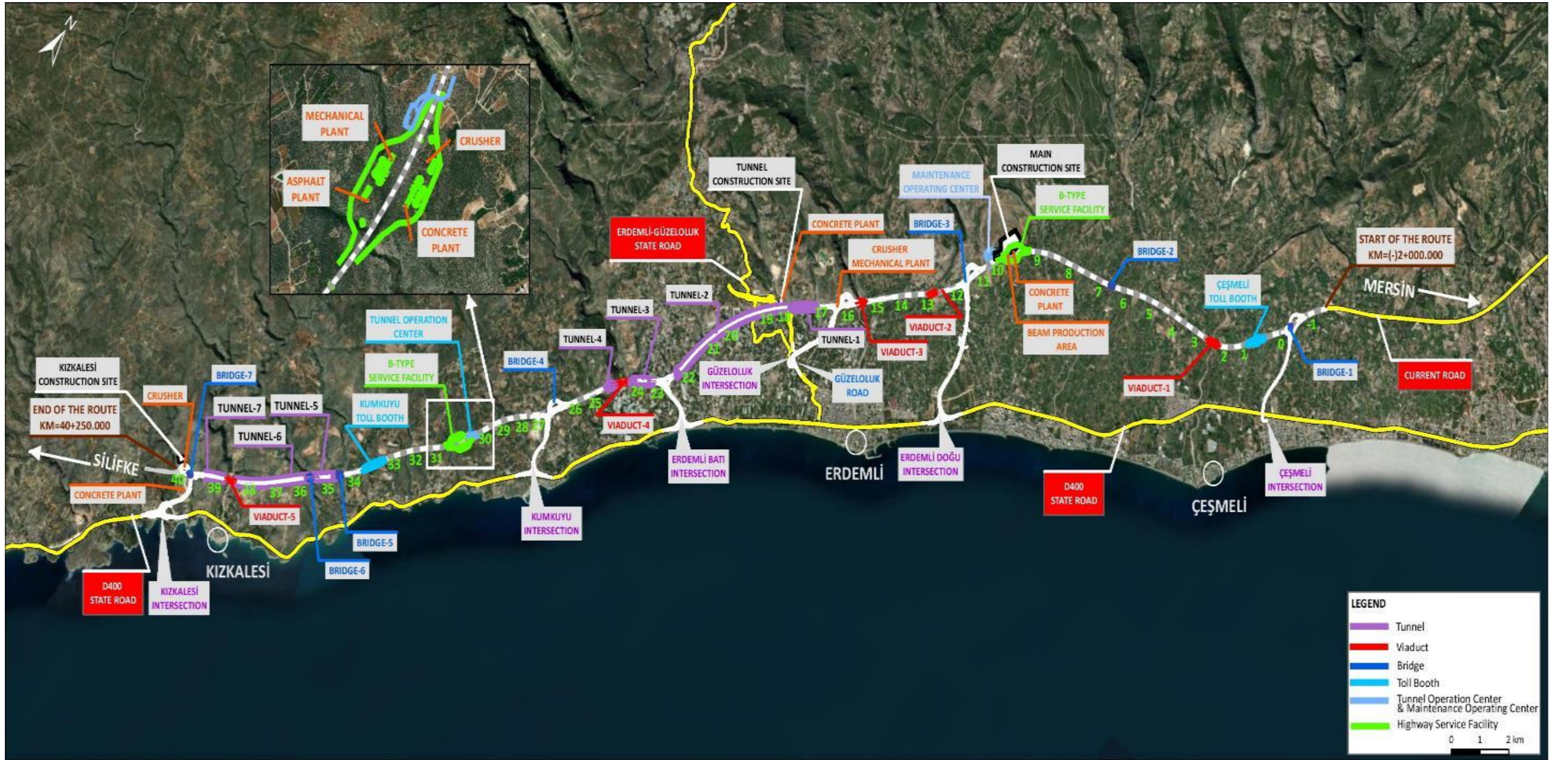
Şekil -2 Proje Güzergahının Temel Bileşenleri